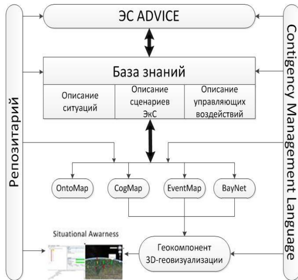
Рисунок 1 -- Архитектура Ситуационного полигона

CML включает словари, описания знаний и операторы манипулирования знаниями.