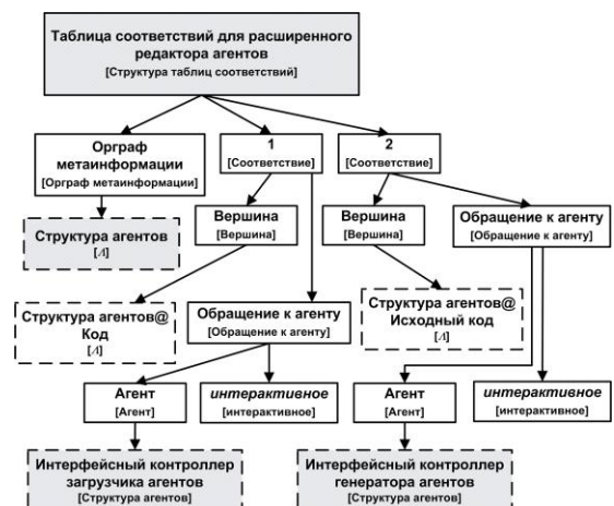
Рисунок 2 – Орграф информации, описывающий таблицу соответствий расширенного редактора агентов

Орграф информации, представляющий таблицу соответствий для расширенного редактора агентов, представлен на рисунке 2. Начальная вершина, имеющая метку «Таблица соответствий для расширенного редактора агентов», закрашена серым цветом, а в квадратных скобках у вершин указаны метки соответствующих вершин из метайнформации.