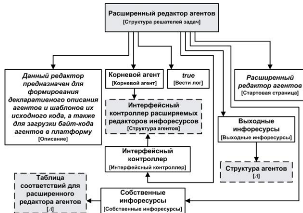
Рисунок 3 – Оргграф информации, представляющий декларативную спецификацию интегрированного решателя задач «Расширенный редактор агентов»

На рисунке 3 представлен оргграф информации, представляющий декларативную спецификацию решателя задач и его связей с другими компонентами, необходимыми для создания сервисов на основе данной спецификации.